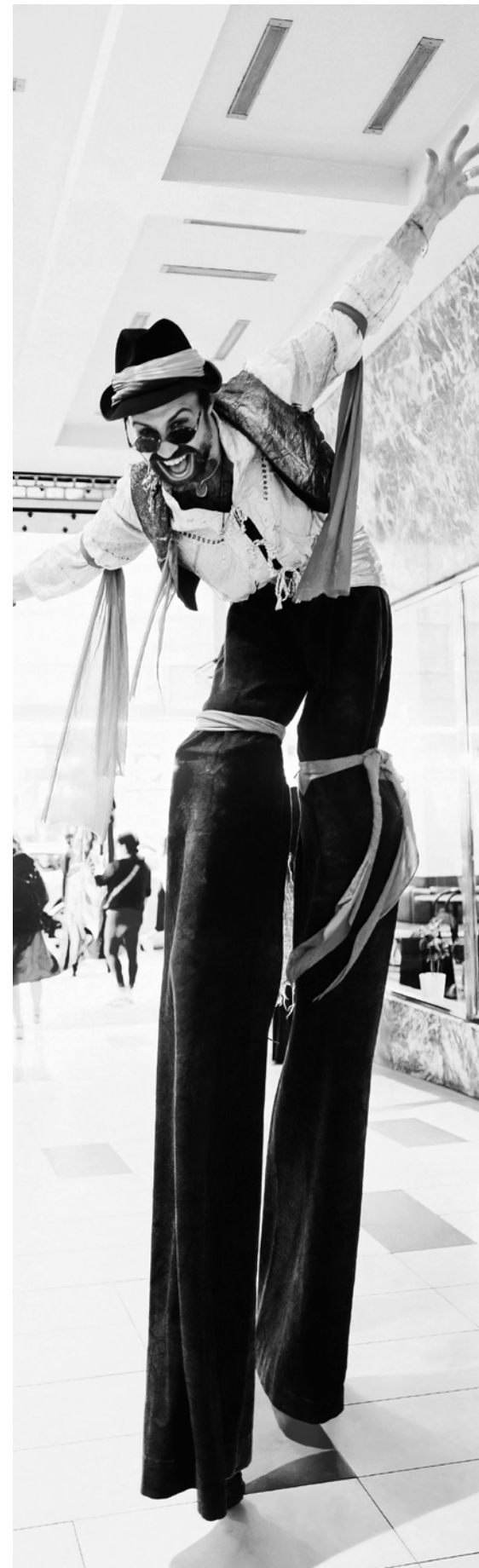
ARA ART: Spektakel und Engagement | Barikano mulatintschago taj keripe

On buteder kojenge andi glajchi cajt ar bescharde on taj use meg al, hot on esbe len, hot on murschen kamen. Taj on akor dschanen, hot ada lengera familijake nisaj schukar koja schaj ol. Butvar adala jekoschne nisaj kojengere darja hi.