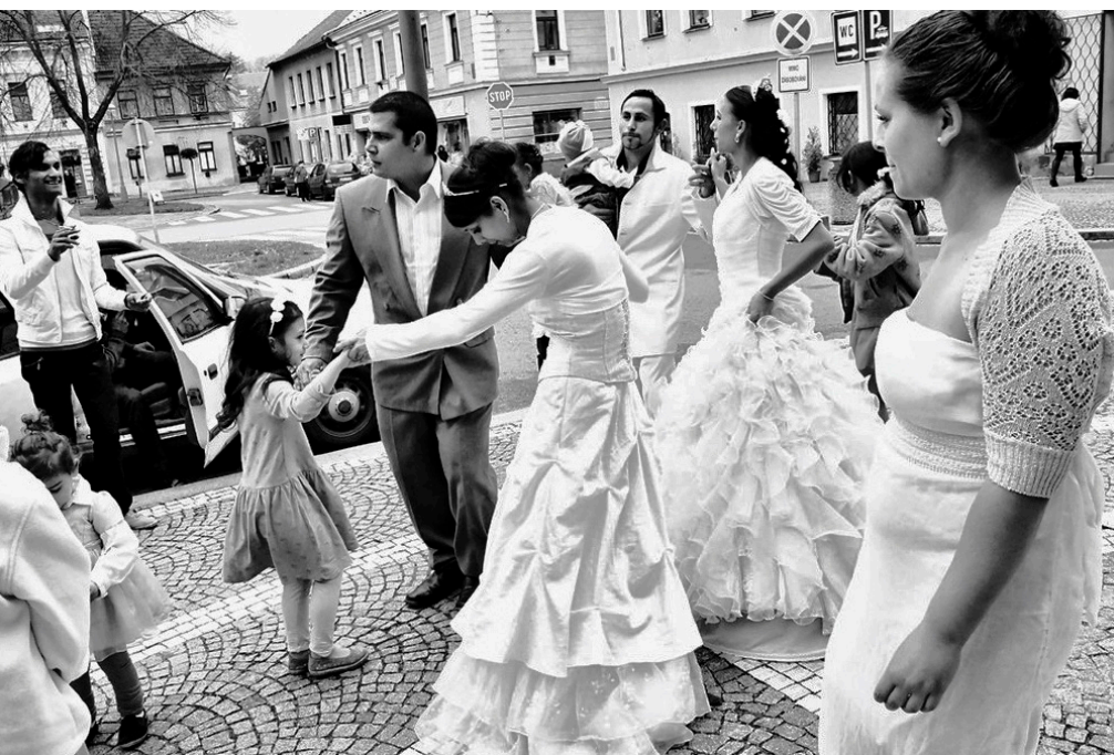
VOR DEM FEST: Roma-Doppelhochzeit in Tschechien ANGLO MULATINTSCHAGO: Duj Romengere-bijava andi Tschechija

Ada tekst 2002 le online-leksikoniske Rombase kerdo ulo.