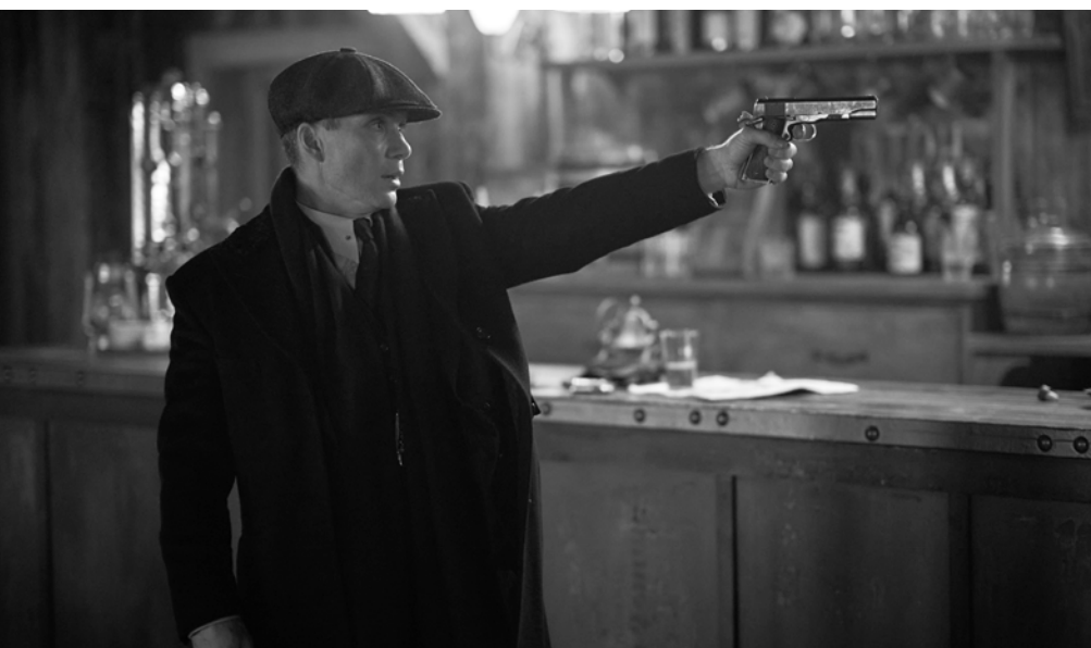
PEAKY BLINDERS: Clanchef Thomas Shelby (Cillian Murphy) bei der Arbeit | Familjakero schero Thomas Shelby (Cillian Murphy) usi buti

O scentscha, save ando baro kher le Anacletijendar khelen, kinstlerischi bari-kane angle asdim hi. Somnak taj phure koji o andrutno than and len, sa ande avdschinakero feschtoskero udud hi. Taj ando palutnipe micindo tradipe del: Murscha, save paschlone, dschuvla ande feschttime rokli taj igen but tschhave te sikan, hot on adaj ande jek durutno them hi – „Othering“ ando serijakero formato.