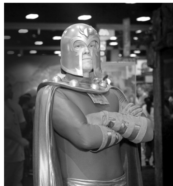
MAGNETO: Tragischer Held | Brigaschno barikano dscheno

O tekst jek falato jeke pisinipeskere redostar le Roma Antidiscrimination Networkistar (RAN) hi.