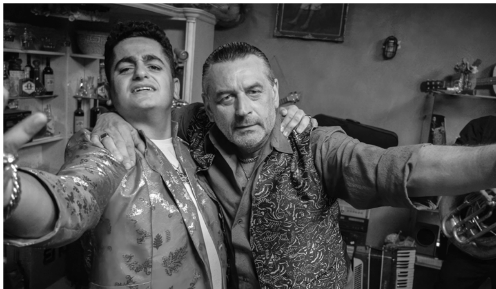
MÄNNER: Das Patriarchat ist keine Erfindung der Roma MURSCHA: O patrijarchat nan jek lakipe le Romendar

Ojs terni Romengeri-dschuvli i Gita jek „andrutni avrutni riktschakeri“ hi, savi hatek i glajchi tschib sar o Roma vakerel, ham o gondolipeskere mustertscha mindenfelitike hi. Lakero telphenipe, pe upro angle dime hirarchiji te likerel taj te soharel, sar le i cili familija uscharel, sikal la Gita ojs terni feministkija, savi lakero ajgeni drom te dschal kamla. Lakere darja hatek traden la, pe gejng o soharipe te