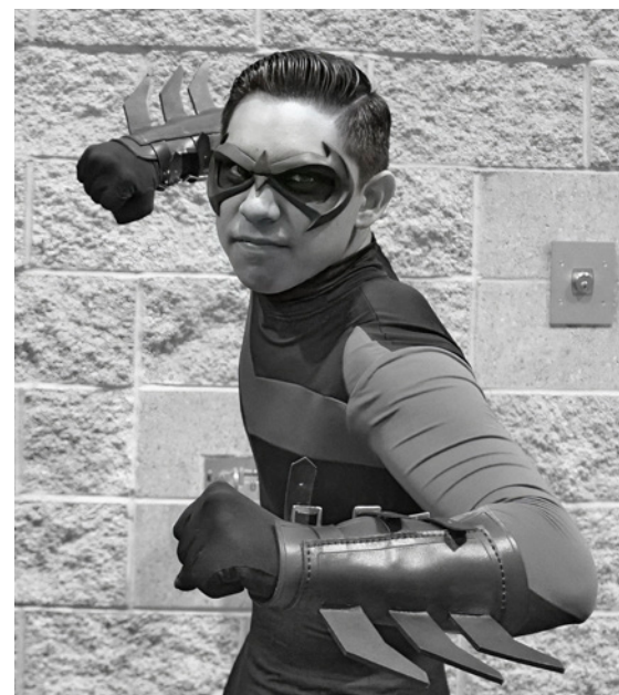
NIGHTWING: Robins neue Identität | Le Robiniskeri nevi identiteta